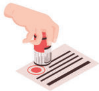
ประทับตราปลอม

ผู้ใดกระทำการเกี่ยวกับเอกสารดังต่อไปนี้ เพื่อให้ผู้อื่นหลงเชื่อว่าเป็นเอกสารที่แท้จริง หรือเพื่อนำเอาเอกสารไปใช้ในกิจการที่อาจเกิดความเสียหายแก่ผู้อื่น ถือว่าผู้นั้นกระทำความผิดฐานปลอมเอกสาร