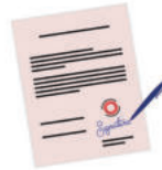
ลงลายมือชื่อปลอม ในเอกสาร