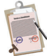
เติม / ตัดทอนข้อความ / แก้ไขข้อความในเอกสาร หรือวัตถุอื่นใด ซึ่งมีลายมือของผู้อื่นโดยมิได้รับความยินยอม หรือฝ่าฝืนคำสั่งของผู้อื่น