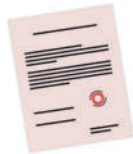
ทำเอกสารปลอมขึ้นทั้งฉบับ หรือส่วนใดส่วนหนึ่ง