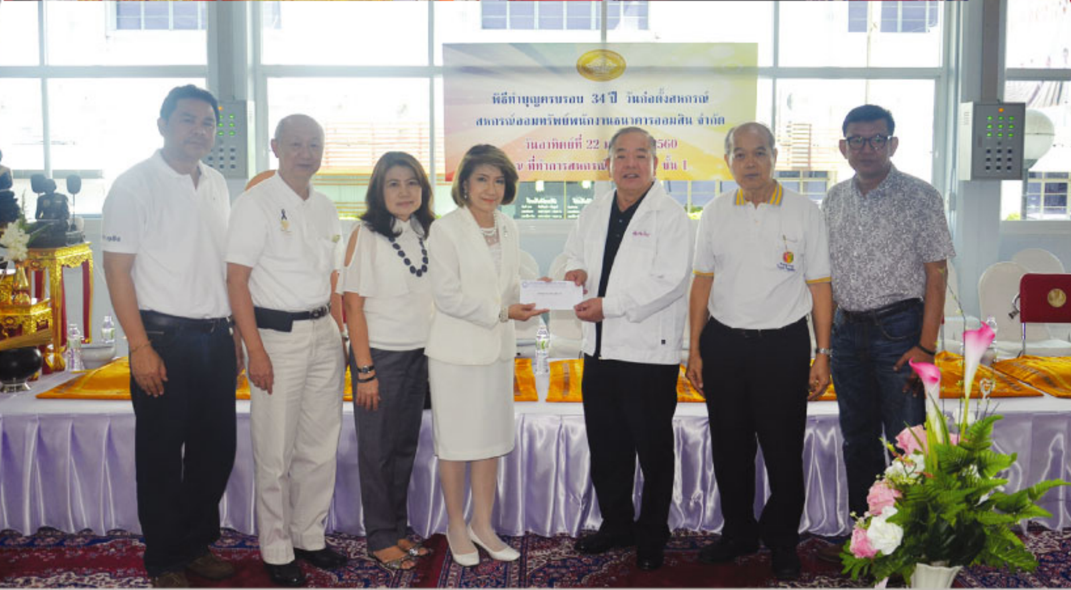
เมื่อวันที่ 22 มกราคม 2560 : สหกรณ์จัดพิธีทำบุญครบรอบ 34 ปี วันก่อตั้งสหกรณ์ ณ อาคารออมสินสำนักงานใหญ่