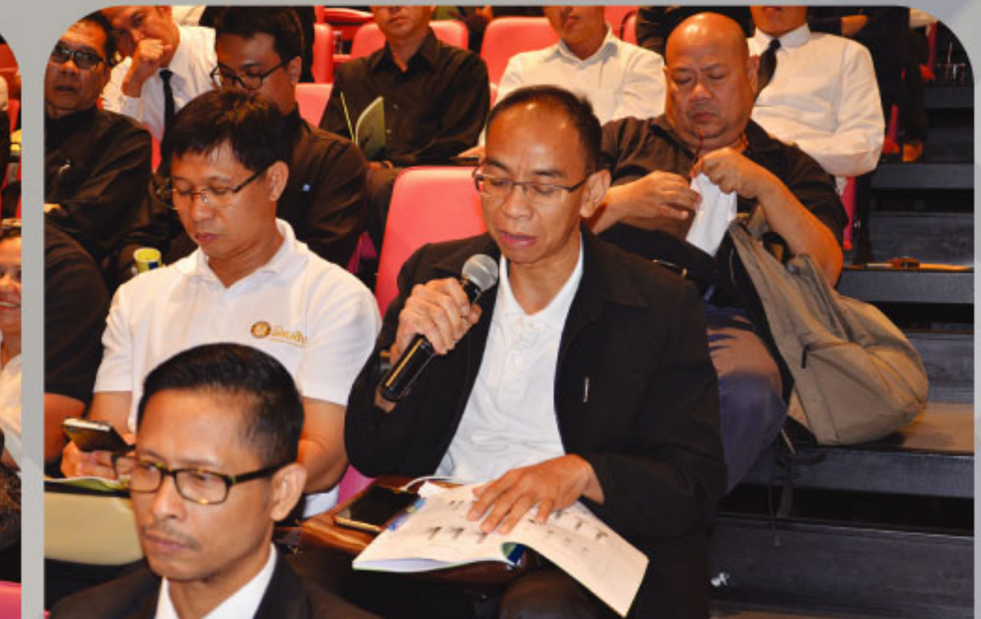
เมื่อวันที่ 20 มกราคม 2560 : สหกรณ์จัดประชุมคณะกรรมการประจำหน่วยงาน ครั้งที่ 1 /2560 ประกอบด้วยระดับฝ่าย จำนวน 39 คน และระดับภาค จำนวน 39 คน รวมจำนวน 78 คน ณ หอประชุมเพชรรัตน อาคารออมสินสำนักงานใหญ่